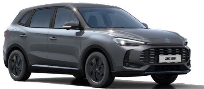
Szary Camden Grey Lakier metaliczny