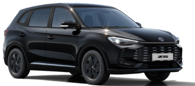
Czarny Pebble Black Lakier metaliczny