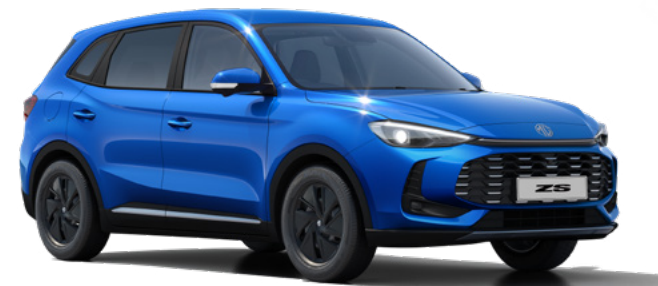
Niebieski Como Blue Lakier metaliczny