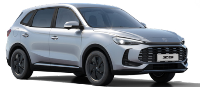
Srebrny Cosmic Silver Lakier metaliczny