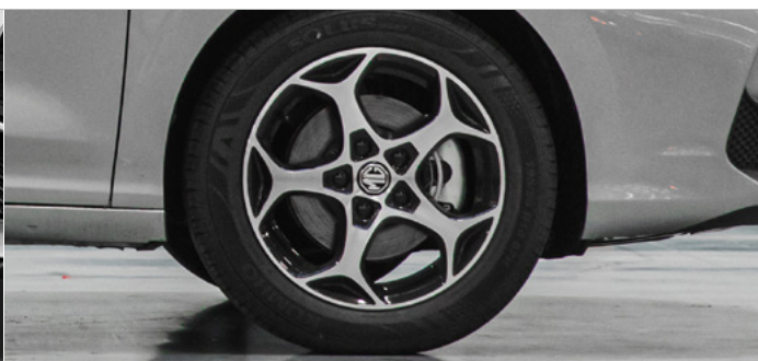
Felgi aluminiowe 16" 195/55 R16