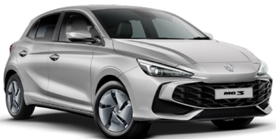
Srebrny Cosmic Silver Lakier metaliczny