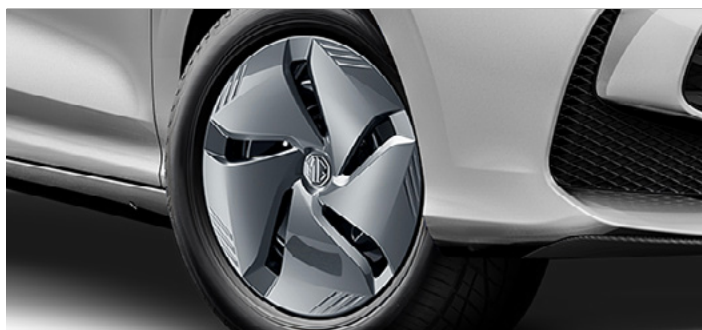
Felgi stalowe 15" 185/65 R15