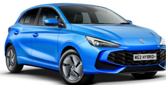
Niebieski Como Blue Lakier metaliczny