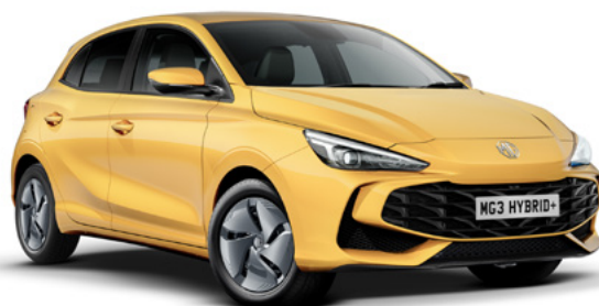
Żółty Pastel Yellow Lakier standardowy