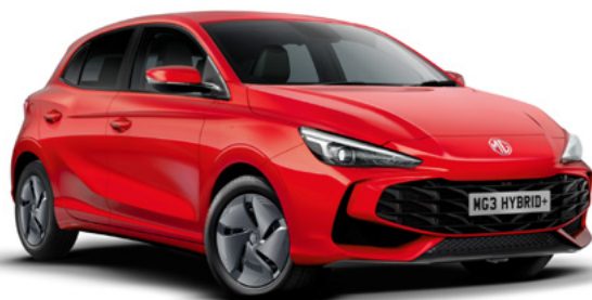
Czerwony Diamond Red Lakier trójwarstwowy