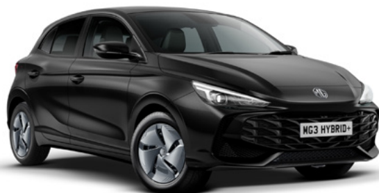
Czarny Pebble Black Lakier metaliczny