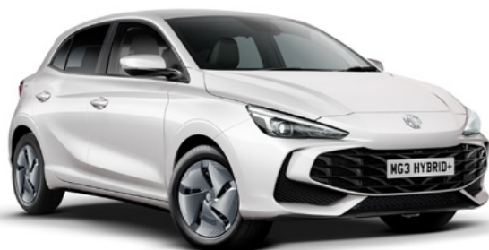
Biały Dover White Lakier standardowy