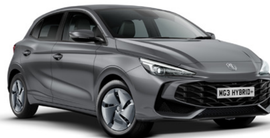
Szary Camden Grey Lakier metaliczny