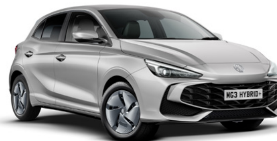
Srebrny Cosmic Silver Lakier metaliczny